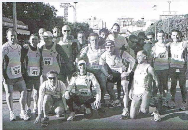
Il gruppo Amatori